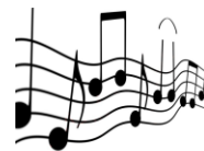
Pan-Europese orkesten 2021

Beeldende Kunsten Theater Opera Circus Literatuur Muziek Dans Mode Erfgoed Design Architectuur Interdisciplinair + audiovisueel