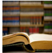
Circulatie Literaire werken